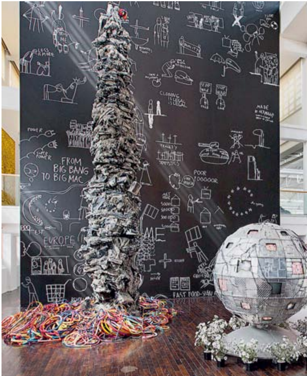
Hier sieht man den so genannten „Lichtturm“ im Ludwig Forum.