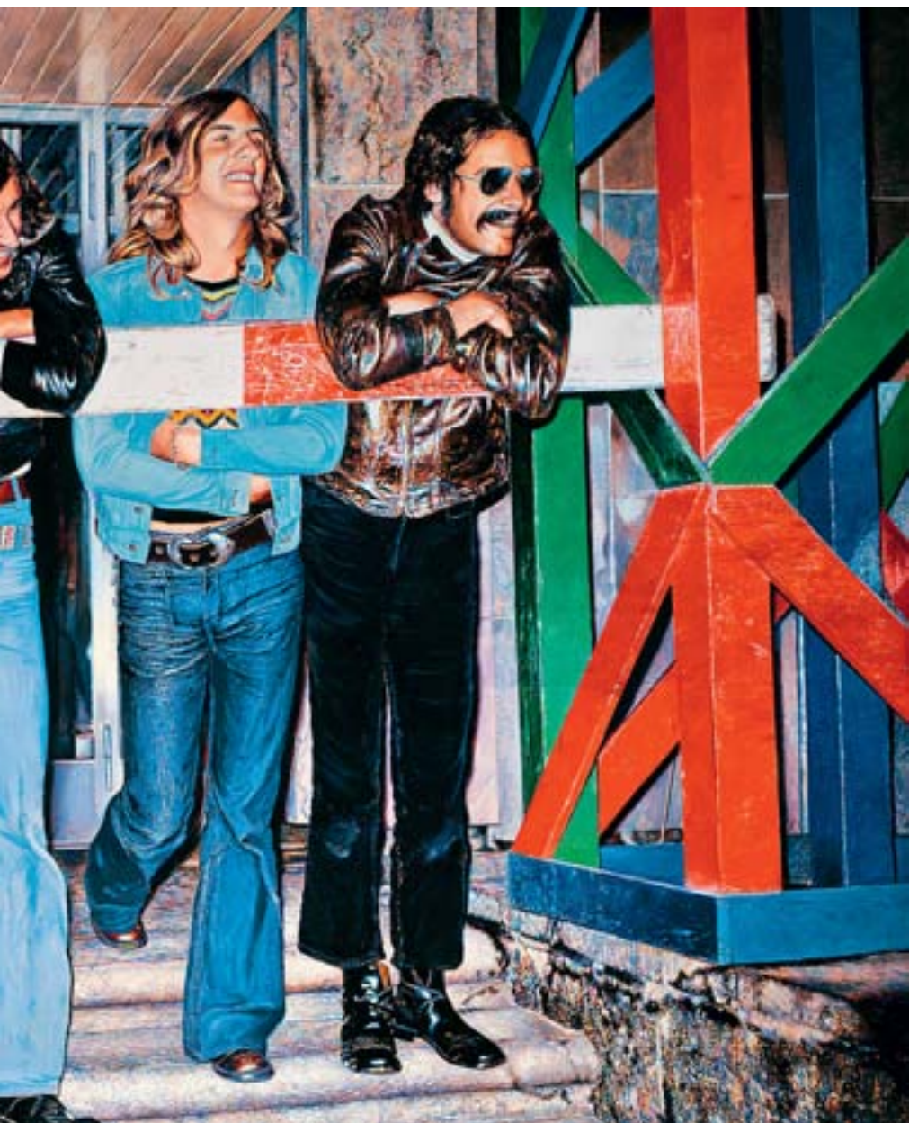
Gertsch 1971 gemalt. Es ist 4 mal 6 Meter groß.