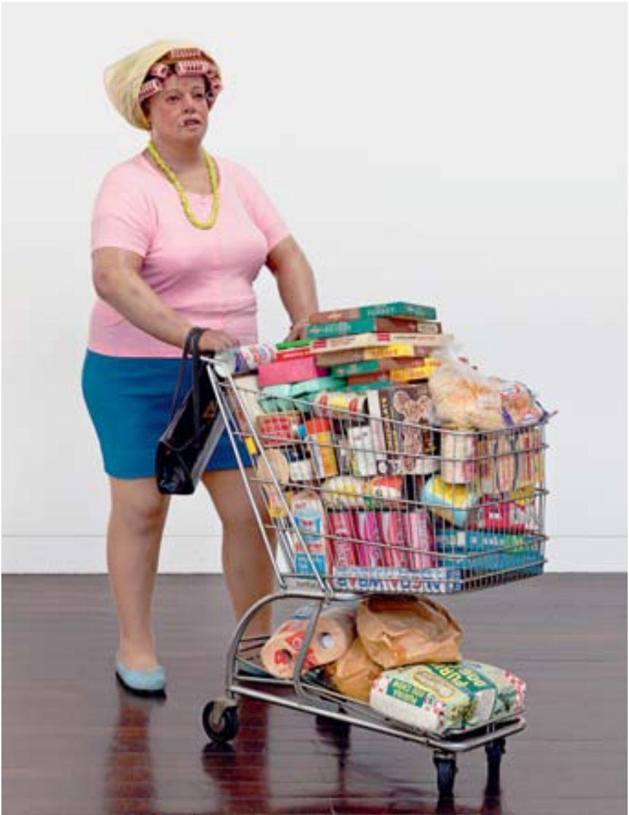
„Supermarket Lady“, eine Frau aus dem Supermarkt, von Duane Hanson, aus dem Jahr 1970.