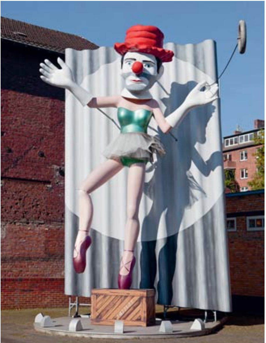
Auf dem Foto sieht man den „Ballerina Clown“ von Jonathan Borofsky, aus dem Jahr 1990.