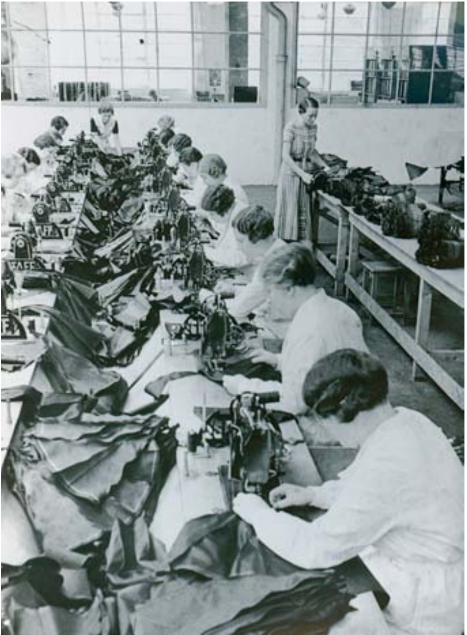
Auf dem Foto sieht man Näherinnen bei der Arbeit.