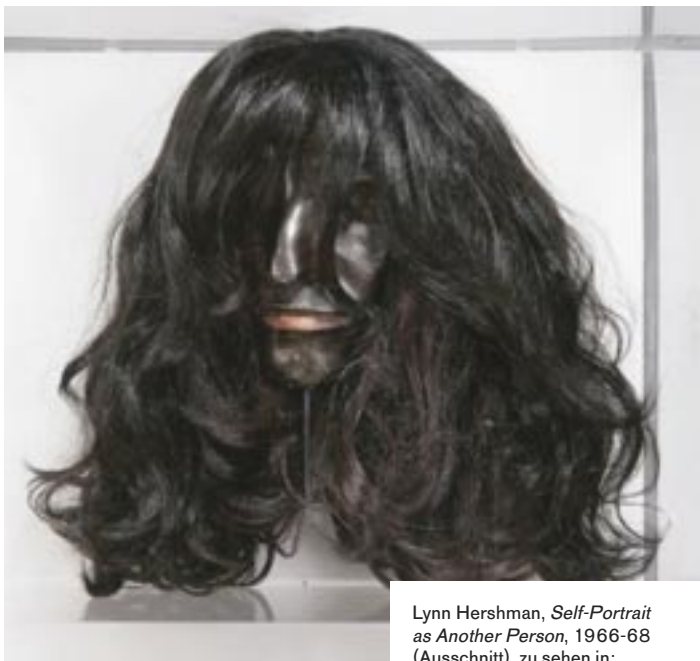
Lynn Hershman, Self-Portrait as Another Person , 1966-68 (Ausschnitt), zu sehen in: Flashes of the Future

So 17.06.2018, 14-16 Uhr KINDERBETREUUNG