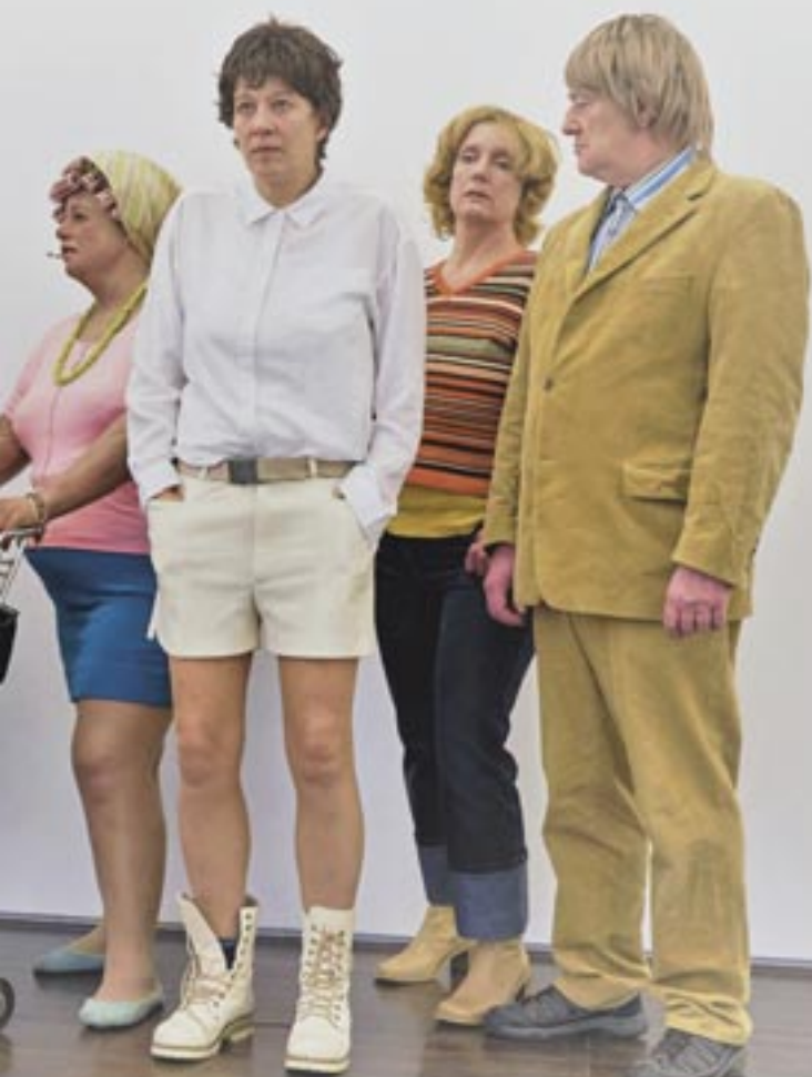
Theater K, Kaspar von Peter Handke, ab Sa 02.06.2018