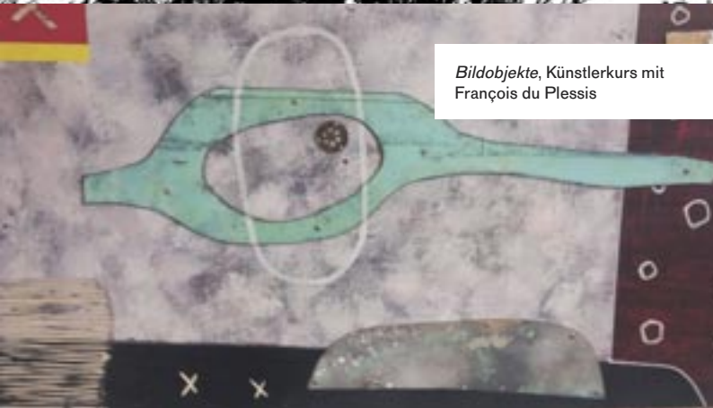
Bildobjekte, Künstlerkurs mit François du Plessis