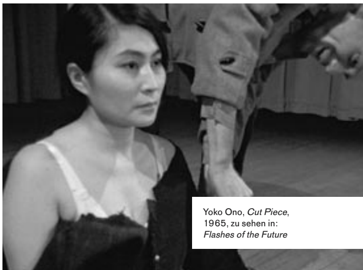
Yoko Ono, Cut Piece , 1965, zu sehen in: Flashes of the Future

So 08.04.2018, 15-16 Uhr KINDERBETREUUNG