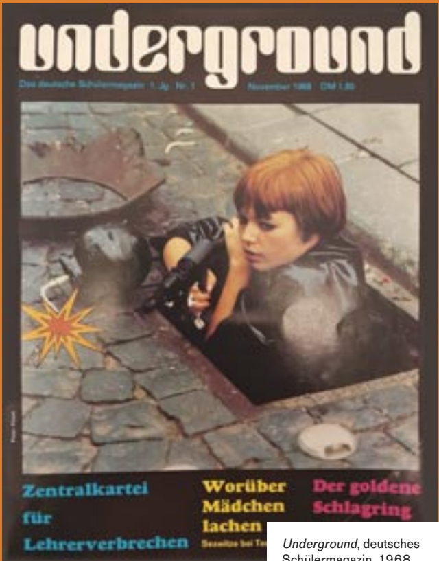
Underground , deutsches Schülermagazin, 1968

Flashes of the Past wants to show a panorama of the 1960s, especially in relation to the important role of the newspaper. To this end, the IZM has a repertoire of numerous original newspapers and magazines that cover the revolutionary topics of the 1960s such as the Vietnam War, student protests in various countries, or events related to the so-called "Prague Spring" in Czechoslovakia. Particular emphasis is placed on the behaviour of the media and the current accusation of one-sided and distorting reporting, in which Springer-Verlag played a decisive role with the Bild-Zeitung. The exhibition is highly interesting from this point of view, especially with regard to the current reference to the "Lying Press".