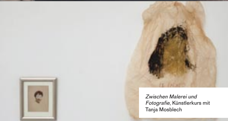
Zwischen Malerei und Fotografie, Künstlerkurs mit Tanja Mosblech