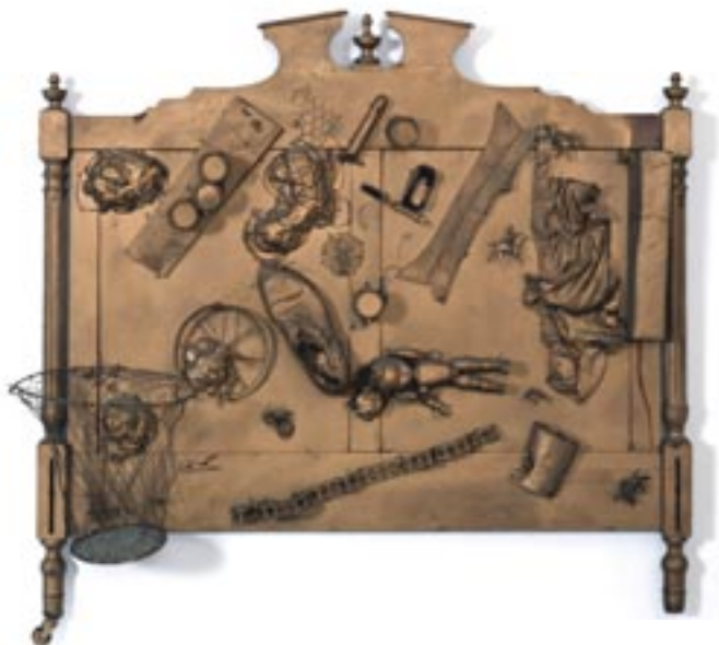
Niki de Saint Phalle, Bett (Komposition) (unbeschossen) , 1961, zu sehen in: Flashes of the Future