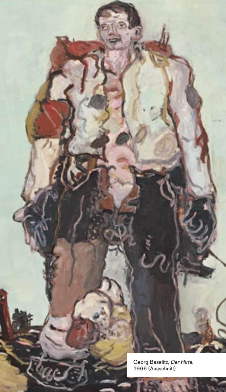
Georg Baselitz, Der Hirte , 1966 (Ausschnitt)