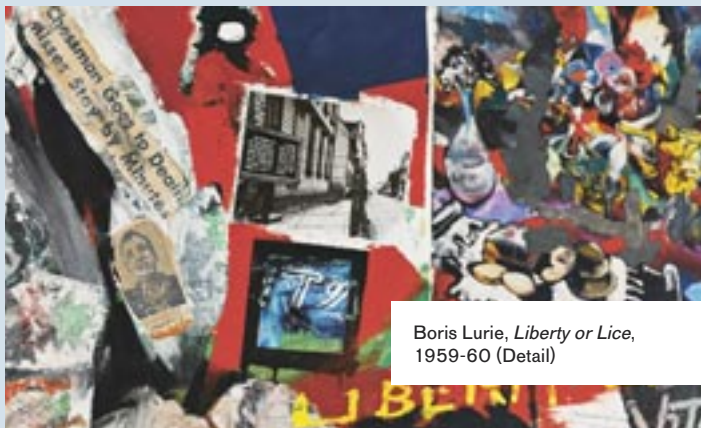
Boris Lurie, Liberty or Lice , 1959-60 (Detail)